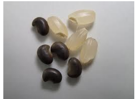
クサネム種子(黒い粒:左)

・クサネムの種子(右の写真)は、ライスグレーダーで取り除けないため、異物混入で落等の原因となります。